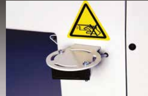
Emniyet sensörü. Safety sensor.