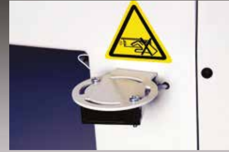
Emniyet sensörü. Safety sensor.