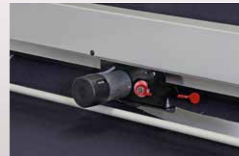
Bıçak sistemi. Cutting system.