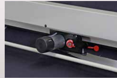
Bıçak sistemi. Cutting system.