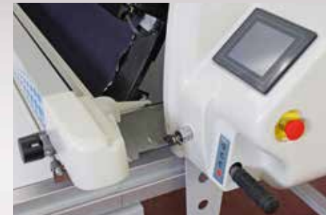
Kolay kullanımlı dokunmatik ekran. Easy to use LCD touch screen.